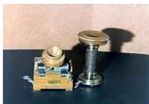
Museo Postal y Telegráfico

Con anterioridad a la creación de la Compañía Telefónica Nacional de España (CTNE), en 1924, el servicio telefónico lo empezó a prestar el Cuerpo de Telégrafos.