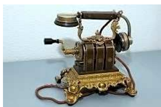
Museo Postal y Telegráfico

Con anterioridad a la creación de la Compañía Telefónica Nacional de España (CTNE), en 1924, el servicio telefónico lo empezó a prestar el Cuerpo de Telégrafos.