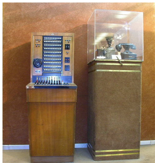
Museo Postal y Telegráfico

En sus inicios, estuvo participada mayoritariamente por la International Telephone and Telegraph Corporation (ITT) de Nueva York. En 1945 el Gobierno decidió que las acciones de la CTNE propiedad de la International Telephone and Telegraph Corporation pasaran a ser propiedad del Estado, que pasó a controlar el 79,6% del total de acciones.